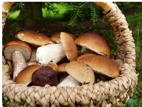
Pilze - Sind auch sie radioaktiv?