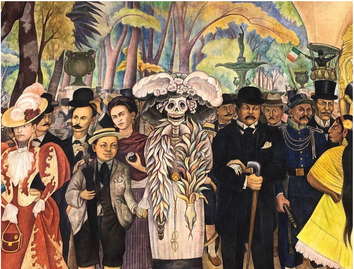
Murales de Diego Rivera, 'Sueño de una tarde dominical en la Alameda Central' (1947)