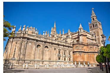
La catedral de Sevilla con la torre Giralda