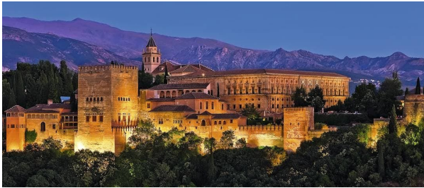
La Alhambra en Granada