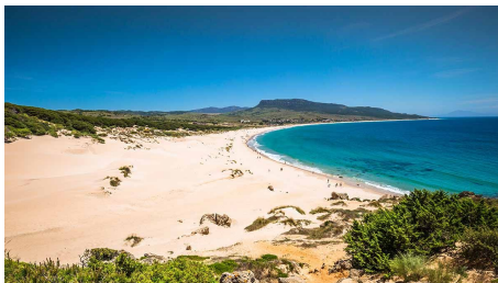
La Playa Bolonia de Tarifa