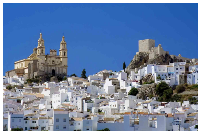
Los pueblos blancos