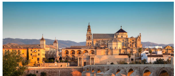
La Mezquita de Córdoba