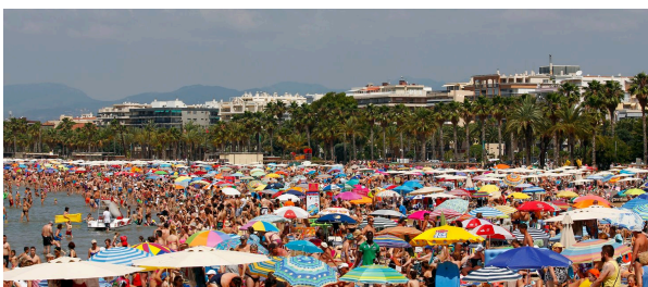
El turismo de masas