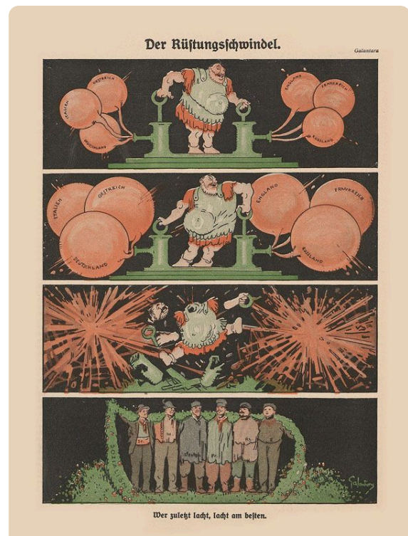
Q5: Karikatur Rüstungsschwindel in Der wahre Jacob 1913 von Gabriele Galantara

Du kannst die Karikatur finden, indem du nach der Autorin von Q5 im Reiter "Personenliste" suchst.