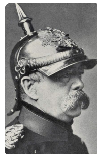
Otto von Bismarck https://t1p.de/tn63