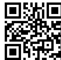
M3 Lückentext https://t1p.de/be5d