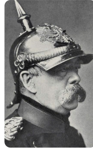
Otto von Bismarck https://t1p.de/tn63