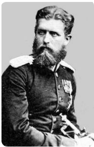
Leopold von Hohenzollern https://t1p.de/xboy