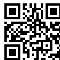
M3 Lückentext https://t1p.de/be5d

Der Lückentext ist zu schwer? Beim Anklicken der Glühbirne links oben werden die Lösungswörter angezeigt!