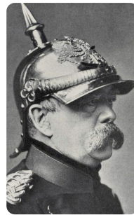
Otto von Bismarck https://t1p.de/tn63