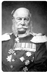
Wilhelm I. https://t1p.de/3fl8