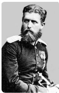
Leopold von Hohenzollern https://t1p.de/xboy