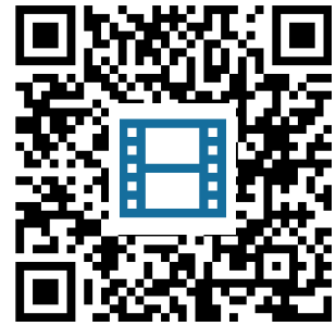
WORD => PDF