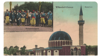
Anvisitenkarte der Holzmoschee

Für die islamische Umma spielt die Moschee eine zentrale Rolle. Sie ist ein Ort des Zusammenkommens und Austauschs. 1914/15 wurde in Deutschland die erste Moschee gebaut (Wünsdorf in Brandenburg). Heute leben zwischen 5,3 und 5,6 Mio. Muslime (Stand 2021) in Deutschland und es gibt überall sehr viele Moscheen. Vier davon könnt ihr jetzt auf einem digitalen Rundgang erkunden.