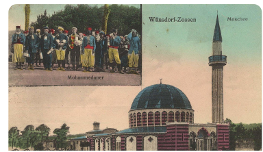
Ansichtskarte der Holzmoschee

Für die islamische Umma spielt die Moschee eine zentrale Rolle. Sie ist ein Ort des Zusammenkommens und Austauschs. 1914/15 wurde in Deutschland die erste Moschee gebaut (Wünsdorf in Brandenburg). Heute leben zwischen 5,3 und 5,6 Mio. Muslime (Stand 2021) in Deutschland und es gibt überall sehr viele Moscheen. Vier davon könnt ihr jetzt auf einem digitalen Rundgang erkunden.