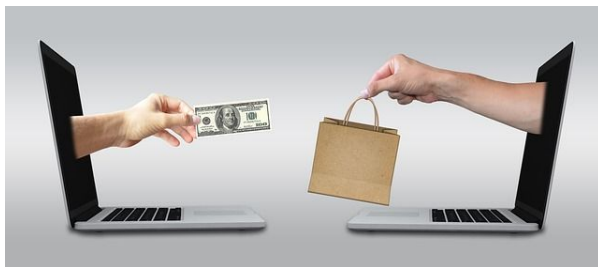
e-commerce, online-verkauf, online-verkäufe