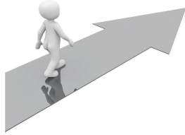
ir todo recto