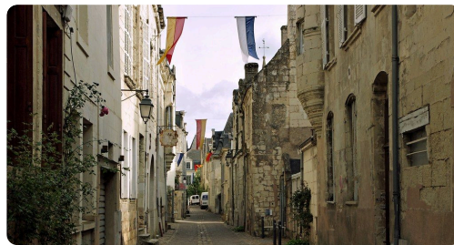
coger la primera segunda tercera calle