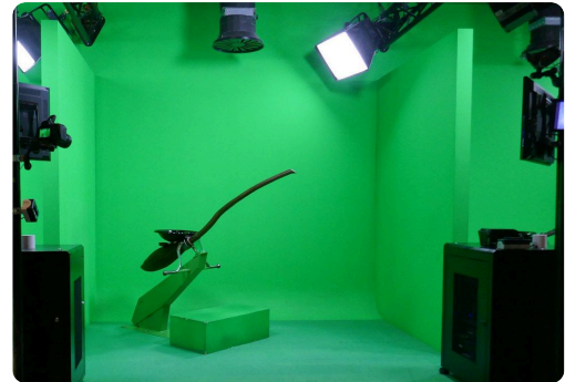
Green Screen Broomstick

Die Greenscreen-Technologie kommt häufig bei Film- und Fernsehaufnahmen zum Einsatz. Dabei werden ein oder mehrere Personen oder auch Gegenstände vor einer grünen Leinwand platziert. Der grüne Hintergrund kann dann anschließend durch ein beliebiges Bild oder Video ausgetauscht werden. Neben einer ausreichenden Beleuchtung ist darauf zu achten, dass die Personen vor der Leinwand nicht die selbe Farbe tragen, da dieser Bereich ansonsten transparent wäre.