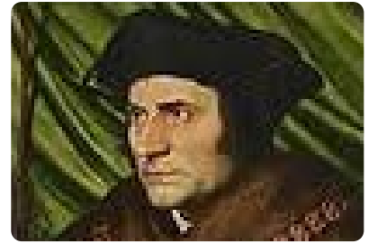
Thomas Morus (1478-1535)

Beschreibe stichpunktartig den Tagesablauf der Utopier, indem du auf die beruflichen Möglichkeiten, den Arbeitsalltag und die Freizeitaktivitäten eingehst!