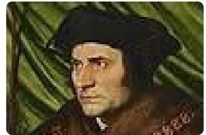
Thomas Morus (1478-1535)

Notiere vier mögliche Kriegsgründe und beschreibe in zwei Stichpunkten die Art der Kriegsführung der Utopier!