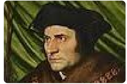
Thomas Morus (1478-1535)

Erstelle anhand der im Text gegebenen Informationen eine Übersicht (schematisch oder stichpunktartig) über die Einrichtungen des politischen Systems.