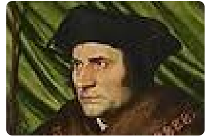
Thomas Morus (1478-1535)

Beschreibe die religiösen Vorstellungen der Utopier anhand von zwei im Text vorkommenden Beispielen und charakterisiere ihre Religionsausübung!