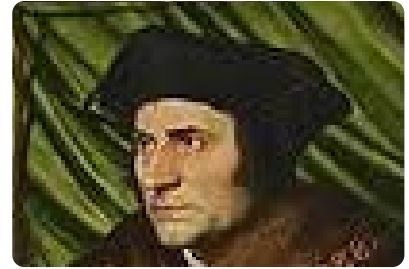
Thomas Morus (1478-1535)