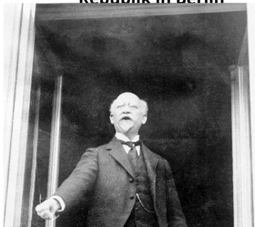
Bild: Philipp Scheidemann in der Reichskanzlei

9. November 1918: Doppelte Ausrufung der Republik in Berlin