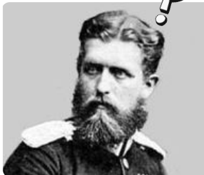
Q2: Leopold von Hohenzollern https://t1p.de/xboy

M4: ein Schaubild digital erstellen www.awwapp.com