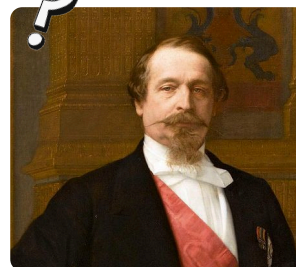
Q4: Napoleon III. https://t1p.de/1vxw