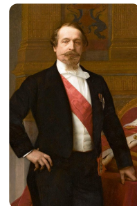
Napoleon III. https://t1p.de/1vx