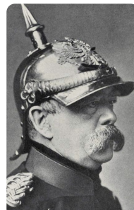
Otto von Bismarck https://t1p.de/tn63