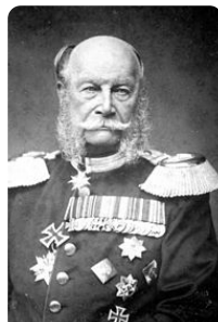
Wilhelm I. https://t1p.de/3fl8