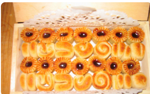
Königsberger Marzipan mit abgeflammter Oberfläche