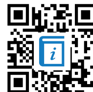
M4: Vorlage Präsentation https://t1p.de/481

② Fasse die Karikatur Q4 in einer Präsentation zusammen. Nutze die Vorlage M4.