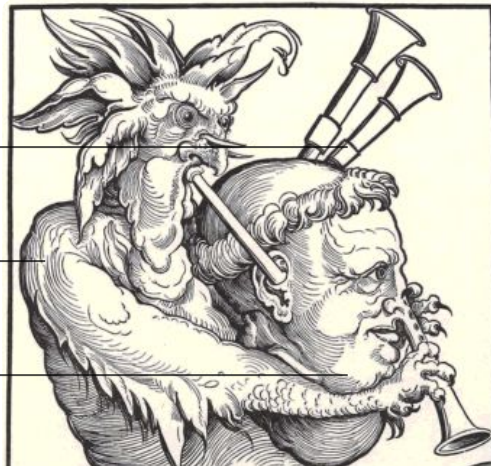
Q4: Luther – des Teufels Dudelsack , Karikatur von Eduard Schön, ca. 1530, [Wikimedia, CC BY SA 4.0] https://t1p.de/482

2. Deuten: Was bedeuten die Bildelemente?