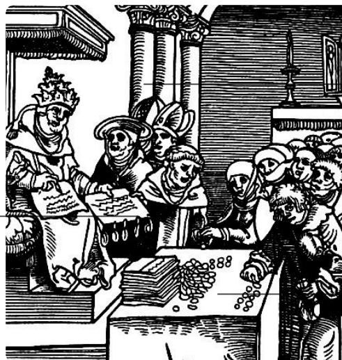
Q3: Ablasshandel, Holzschnitt von Lucas Cranach von 1521, (Wikimedia, CC BY SA 4.0] https://t1p.de/479