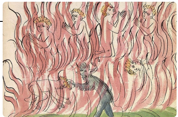
Q1: Fegefeuerdarstellung von 1419 , Universitätsbibliothek Heidelberg (Wikimedia, CC-0) https://t1p.de/490