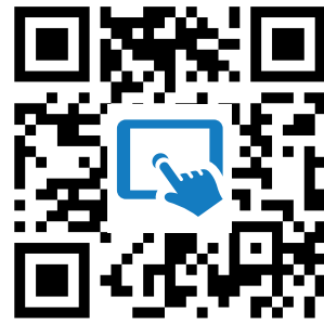
M4: Quiz https://t1p.de/h53r

Klicke im Quiz auf das "i" in der rechten Ecke der Bausteine, um mehr über die drei ägyptischen Jahreszeiten zu erfahren.