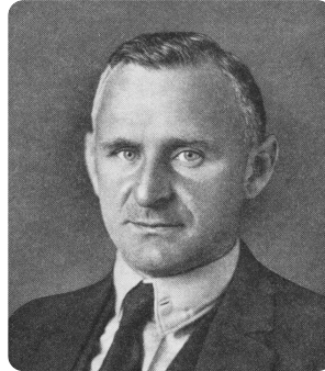
Q1: Carl Friedrich Goerdeler