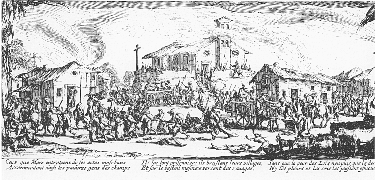
Q4: Zerstörung und Verbrennung eines Dorfes, Kupferstich von 1633, wikipedia.com, gemeinfrei

① Beschreibt die euch vorliegende Bildquelle Q4 hinsichtlich: