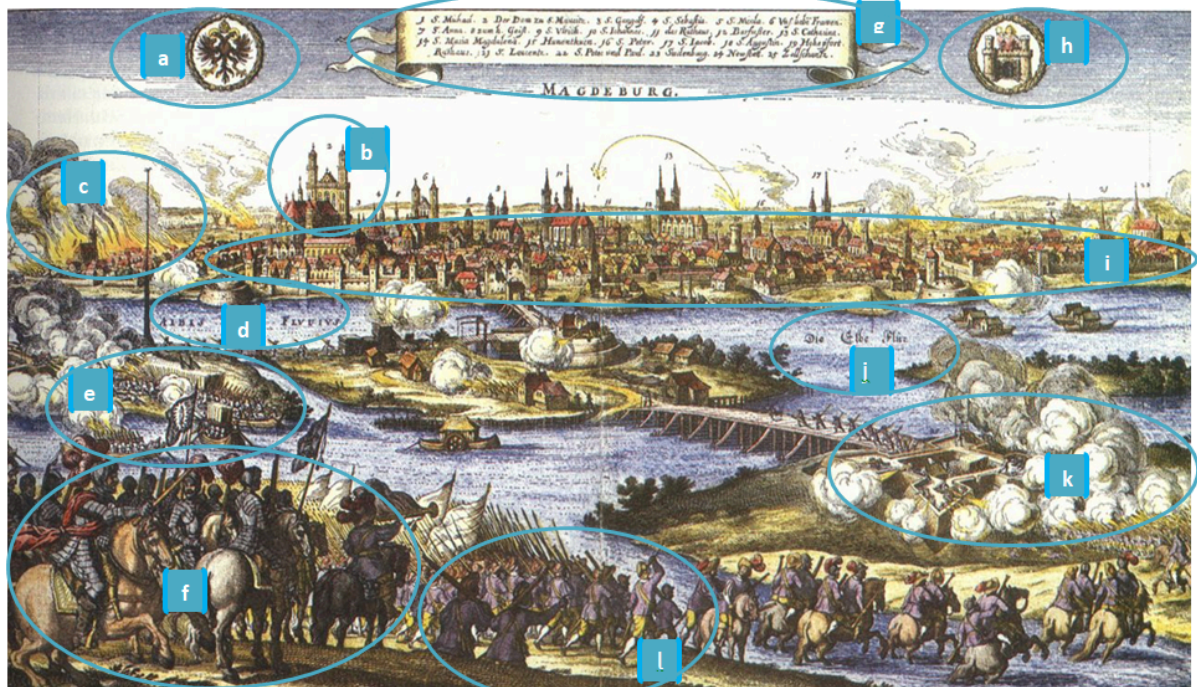
Q1 Zeichnung: Sturm auf Magdeburg, 1631, wikipedia.com, gemeinfrei