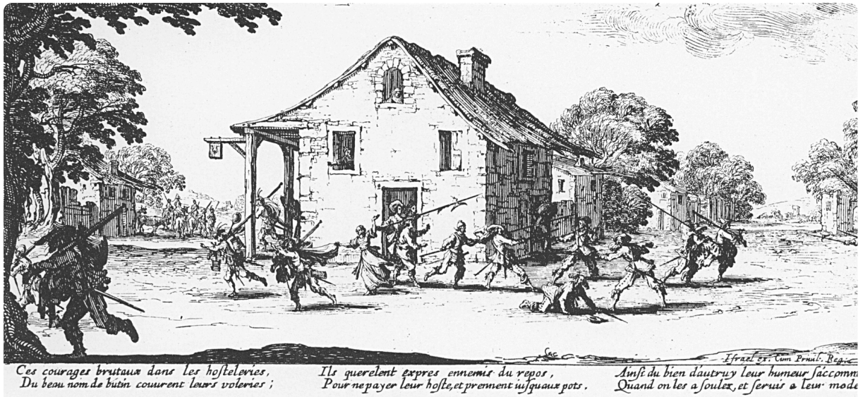
Q2: Die Plünderung, Kupferstich von 1633, wikipedia.com, gemeinfrei

① Beschreibt die euch vorliegende Bildquelle Q2 hinsichtlich: