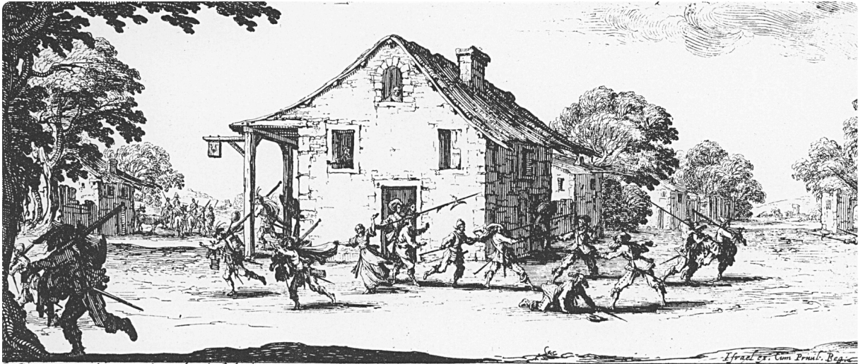
Ces courages brutaux dans les hosteleries, Du beau nom de hûtes courent leurs voleries ; Ils querelent expres ennemis du repos, Pour ne payer leur hôte, et prement usquaux pots . Ainsi du bien d'autrui leur humeur s'accomme Quand on les a soulez, et seruir à leur mode