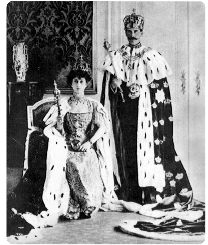
King and Queen of Triadis

Schreibe die Dreiklagstöne mit jeweils einer Leertaste zwischen den Tönen