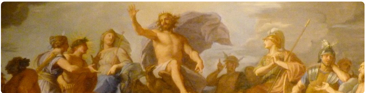
M1: Göttervater Zeus mit den olympischen Göttern

In prächtigen Tempeln wurden die Götter verehrt. Im Inneren des Tempels war eine Statue der Göttin Athene. Diesen Innenraum durften die meisten Menschen nicht betreten. Nur die Priester hatten Zutritt. In Kriegszeiten dienten die Tempel als Zufluchtsort. Auch fremde Krieger durften die Tempel dann nicht betreten. Den Göttern wurden von den Menschen viele Opfer dargebracht: Früchte und Tiere. Die Menschen aßen das Fleisch, weil sie glaubten, dass die Götter nur die Knochen und die Überreste verspeisen würden. Die Menschen hofften durch die Opfergaben, dass die Götter ihnen helfen.