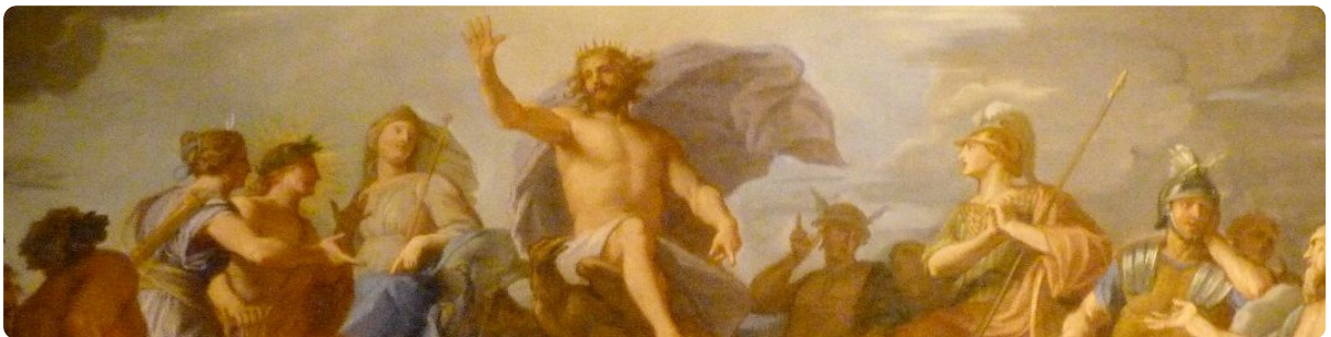
M1: Göttervater Zeus mit den olympischen Göttern

In prächtigen Tempeln wurden die Götter verehrt. Im Inneren des Tempels war eine Statue der Göttin Athene. Diesen Innenraum durften die meisten Menschen nicht betreten. Nur die Priester hatten Zutritt. In Kriegszeiten dienten die Tempel als Zufluchtsort. Auch fremde Krieger durften die Tempel dann nicht betreten. Den Göttern wurden von den Menschen viele Opfer dargebracht: Früchte und Tiere. Die Menschen aßen das Fleisch, weil sie glaubten, dass die Götter nur die Knochen und die Überreste verspeisen würden. Die Menschen hofften durch die Opfertgaben, dass die Götter ihnen helfen.