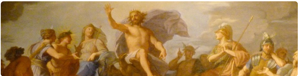
M1: Göttervater Zeus mit den olympischen Göttern

In prächtigen Tempeln wurden die Götter verehrt. Im Inneren des Tempels war eine Statue der Göttin Athene. Diesen Innenraum durften die meisten Menschen nicht betreten. Nur die Priester hatten Zutritt. In Kriegszeiten dienten die Tempel als Zufluchtsort. Auch fremde Krieger durften die Tempel dann nicht betreten. Den Göttern wurden von den Menschen viele Opfer dargebracht: Früchte und Tiere. Die Menschen aßen das Fleisch, weil sie glaubten, dass die Götter nur die Knochen und die Überreste verspeisen würden. Die Menschen hofften durch die Opfertgaben, dass die Götter ihnen helfen.