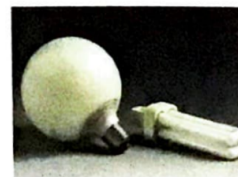
11 Sparlampen (Argon)