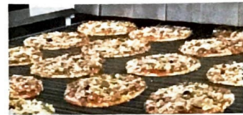
6 Schockgefrieren durch Stickstoff