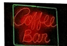
10 Leuchtröhren (Neon)