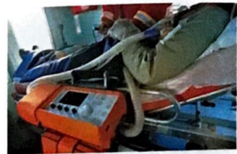
2 Künstliche Beatmung