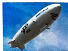
9 Luftschiff (Helium)