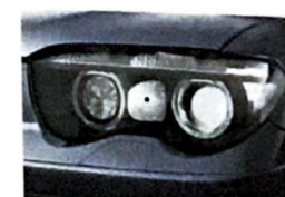
12 Scheinwerfer (Xenon)