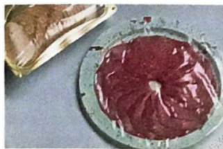
4 Stickstoff schützt Lebensmittel.