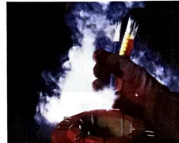
7 Stickstoff in der Tierzucht