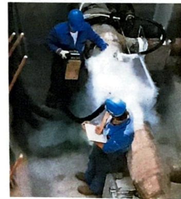
8 Stickstoff zum „Rohrfrosten“