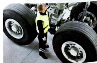
5 Mit Stickstoff befüllte Reifen