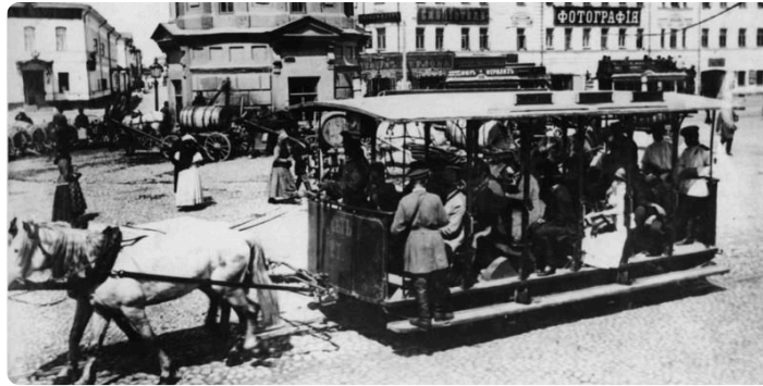
Q5: Moskau Pferdebahn

Mit der Straßenbahn durch Leipzig zu fahren, ist heute ganz normal. Doch das war nicht immer so. Am 18. Mai 1872 begann mit der Eröffnung des Linienbetriebs der Leipziger Pferde-Eisenbahn die Geschichte der Straßenbahn in Leipzig. Die Abbildung Q5 zeigt dir, wie die Pferdestraßenbahn ausgesehen hat.