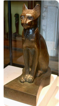
Abb.1 - Ägyptische Skulptur

Schon die Ägypter hielten Katzen als Haustiere. Aber auch in anderen Regionen der Erde leben Katzen schon lange gemeinsam mit den Menschen. Katzen wurden in einigen Teilen der Welt sogar verehrt.