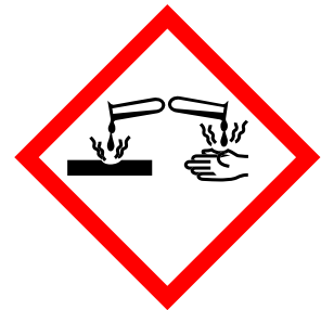
Abb.1: Ätzend!

Schon im Mittelalter hat man sich die ätzende Wirkung von Säuren zu Nutze gemacht und mit Säuren Muster als Verzierungen in Rüstungen und Helme aus Metall geätzt. Auch heutzutage wird in der Kunst die sogenannte Ätzeradierung noch genutzt. Die ätzende Wirkung von Säuren ist jedoch nicht nur nützlich, sondern kann auch gefährlich sein. Saure Lösungen können lebendes Gewebe angreifen und Oberflächen beschädigen. Deswegen ist beim Umgang mit Säuren stets Vorsicht geboten.