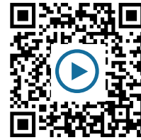
M6: Video Mauerfall

② Benenne Umstände, die zum Fall der Berliner Mauer führten. (3 Minuten)