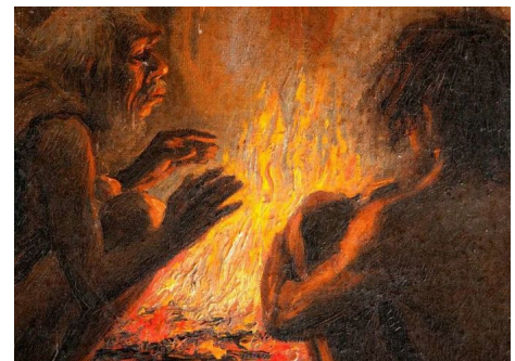
Fröhmenschen wärmen sich am Feuer