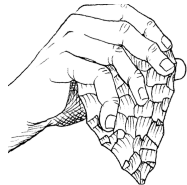
Hand hält Faustkeil