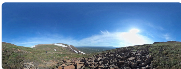
Google Street View