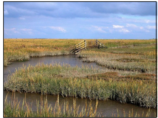
M3: Salzwiese am Wattenmeer