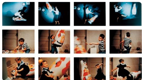
File:Bobo Doll Deneyi.jpg