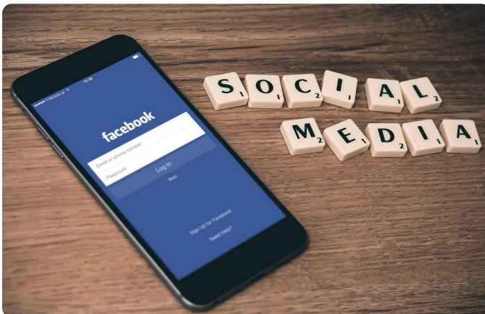
social media, facebook, smartphone