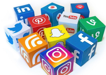
Social Media Mix 3D Icons - Mix #1

Das alltägliche Gemetzel in Film und Fernsehen