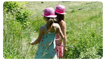
Abb. 6 — Kinder gehen spazieren