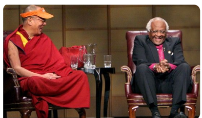
Abb. 8 — Dalai Lama