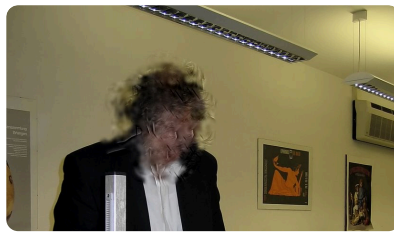
Abb. 5 — Person