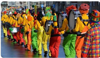
Abb. 4 — Karneval