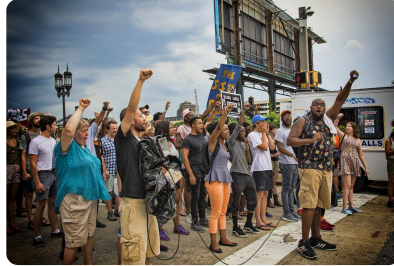
Abb. 2 — Protest