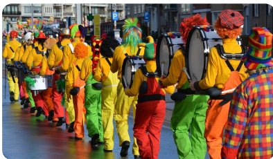
Abb. 4 — Karneval