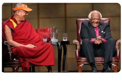
Abb. 8 — Dalai Lama