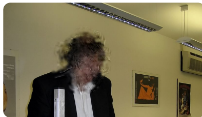
Abb. 5 — Person