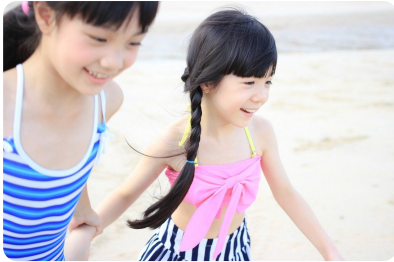
Abb. 1 — Kinder am Strand

③ Entscheidet (wieder in Partnerarbeit) bei den unten dargestellten Bildern, ob diese rechtlich problematisch sind oder nicht. Begründet eure Entscheidung.