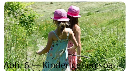
Abb. 6 — Kinder gehen spazieren