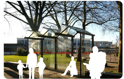
Abb. 3 — Bushaltestelle