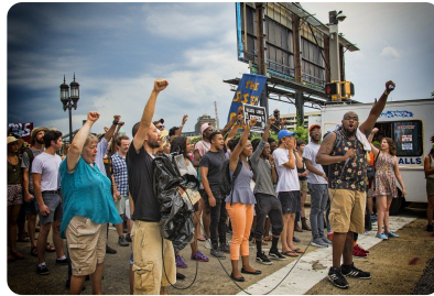
Abb. 2 — Protest