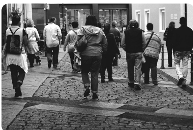
Abb. 7 — Straße