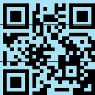
Q2 Brief https://t1p.de/l3u8x