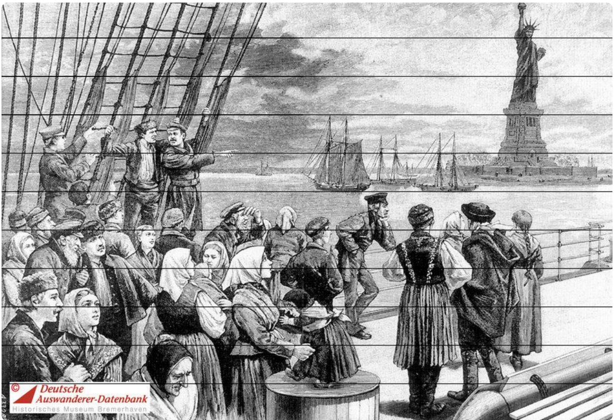
Q1 Ankunft von Auswanderern in New York, Holzstich von 1896