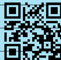
M1 Padlet https://t1n.de/89c7n