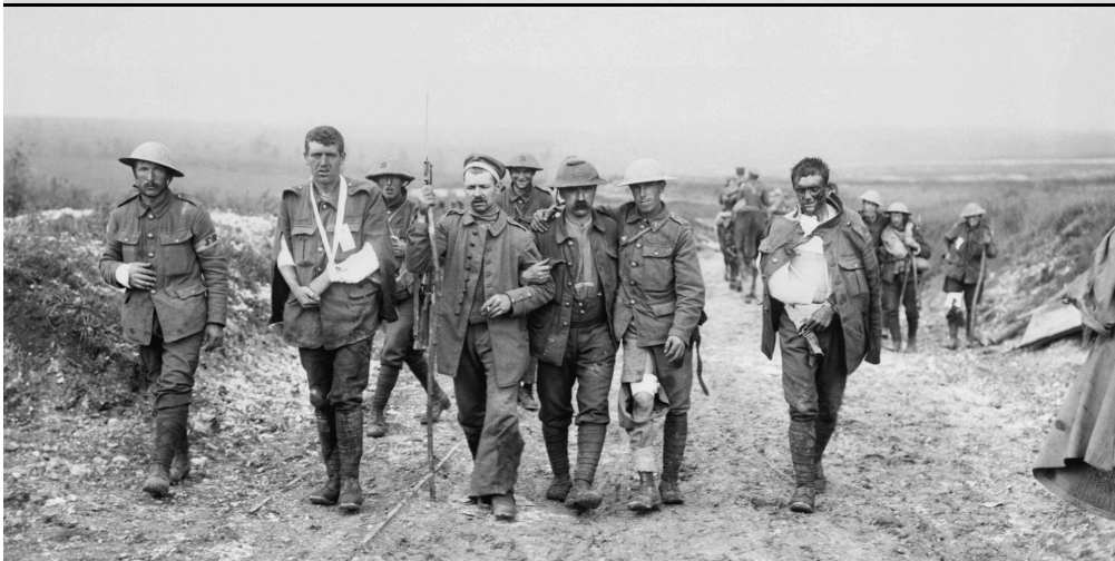
British wounded Bernafay Wood 19 July 1916

Verwundete britische Soldaten im Ersten Weltkrieg auf dem Weg zu einem Truppenverbandsplatz