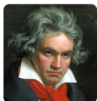
Ludwig van Beethoven