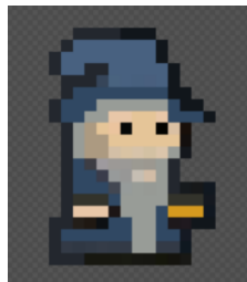
CC BY-NC-SA 4.0