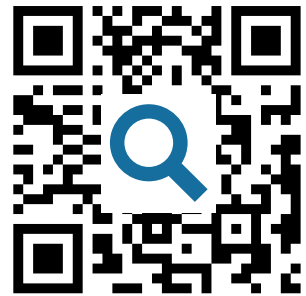
M5: Corona Archiv https://t1p.de/3dbx