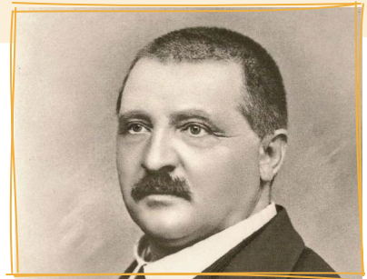
Anton Bruckner 1868